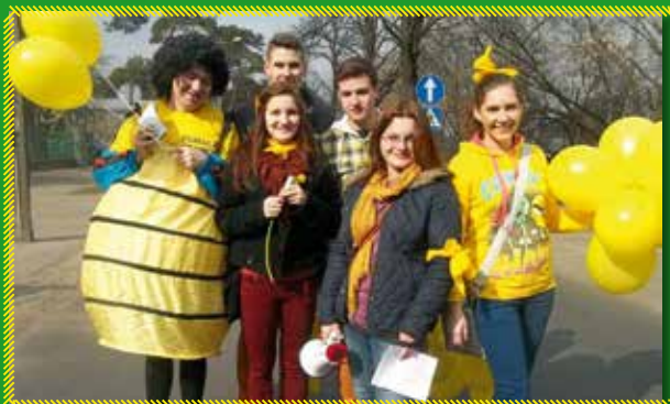
Wolontariusze Centrum Wolontariatu z Garwolina