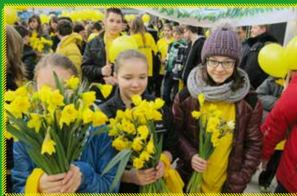
Gimnazjum nr 4 z Otwocka