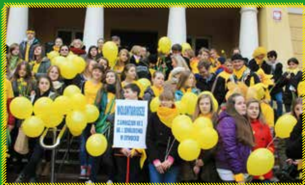
Wspólnie przed Urzędem Miasta