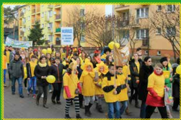
Marsz Nadziei w Otwocku