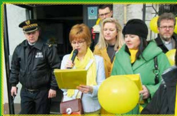
Powitanie przed Urzędem Starostwa