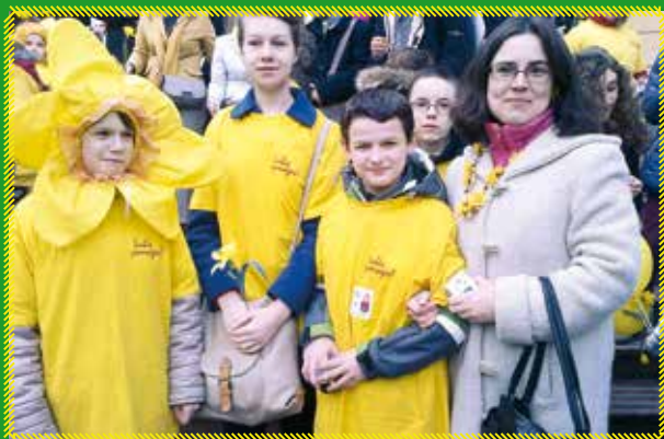
Gimnazjum z Kołbieli