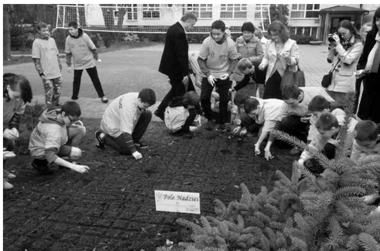
Pole Nadziei w Ośrodku „Jędrus” w Józefowie