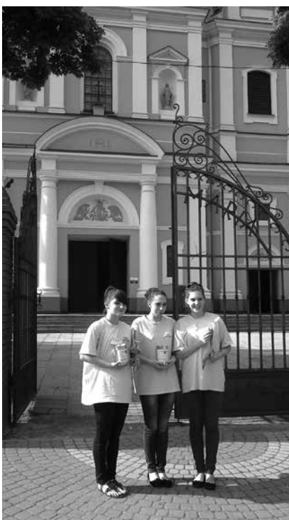
Wolontariusze OTOP podczas kwesty w Parysowie

Dziś przede wszystkim dziękujemy szkołom z Otwocka, Józefowa, Karczewa, Kołbieli, Osiecka, Miętneho, Garwolina, Woli Rębkowskiej, Woli Władysławowskiej, które z nami współpracują na co dzień pomagając naszym hospicjom. Dziękujemy za to, że dyrektorzy i pedagodzy tych placówek pamiętają o uwrażliwianiu młodych ludzi na potrzeby drugiego człowieka. Razem udaje nam się propagować wolontariat wśród kolejnych pokoleń.