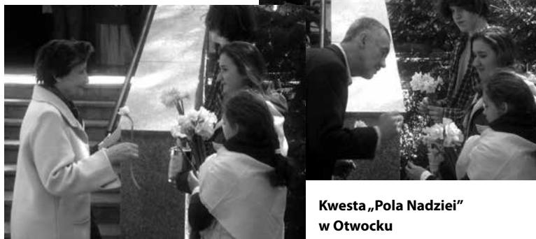
Kwesta „Pola Nadziei” w Otwocku