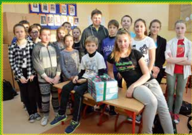
SP w Woli Władysławowskiej