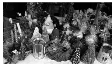
Kiermasz w Otwocku