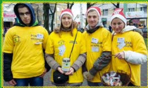
Piernikowa akcja w Garwolinie – wolontariusze ZSP nr 2

Pomogliśmy już ponad 1000 pacjentów i ich rodzinom!