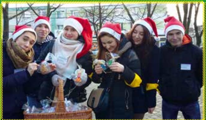
Piernikowa akcja 12 XII w Garwolinie