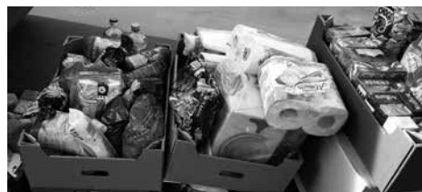
To tylko część zebranych artykułów dla rodziny