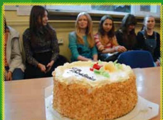
ZSP nr 2 im. T. Kościuszki w Garwolinie