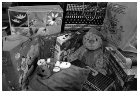
Dzień Pluszowego Misia